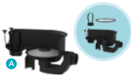
> Compartiment filtres pour les cuves ECOSLIM de 3 000 à 7 000 L